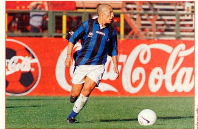
El volante cumple su segunda temporada en Huachipato. Su pena es que aún no anota un gol para los acereros.

✓ "Le entiendo todo a Percic. Pero en las primeras charlas, sacaba las ideas por deducción futbolística"