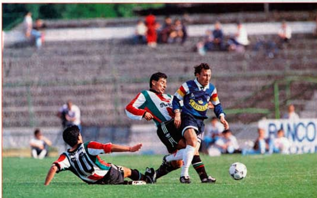
Condorito actuó por Provincial Osorno durante la temporadas '94 y '95. En el sur, las gambetas y toques del talentoso volante destacaron dentro de un plantel reducido en figuras.