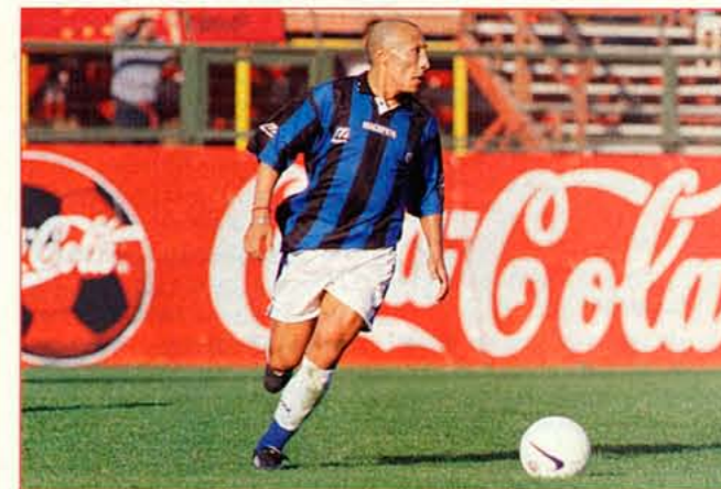
El volante cumple su segunda temporada en Huachipato. Su pena es que aún no anota un gol para los acereros.

✓ "Le entiendo todo a Percic. Pero en las primeras charlas, sacaba las ideas por deducción futbolística"